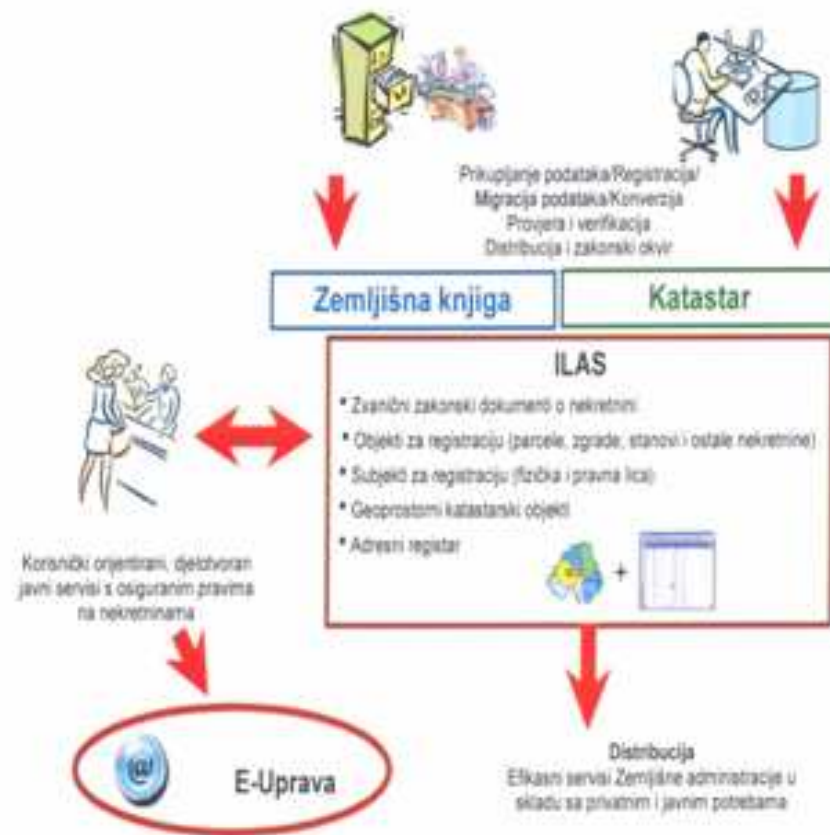
Slika 2. ILAS strategija u FBiH