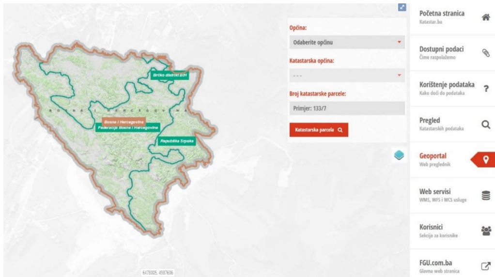
Slika 2. Geoportal FGU (URL 1)

podataka Federacije Bosne i Hercegovine te zainteresirani korisnici mogu pretraživati sluffbene podatke putem broja katastarske estice ili broja posjedovnog lista.