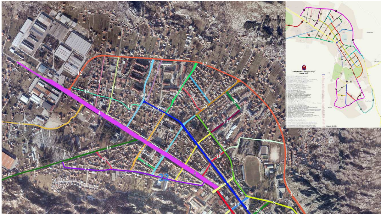
Slika 4. Primjer raspoloživih podataka u digitalnoj formi