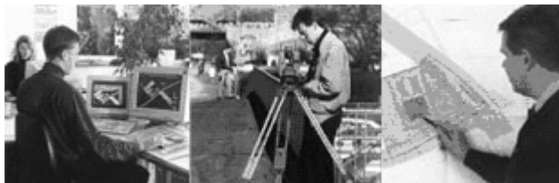
Slika 2. Ovlašteni geodeta u svakodnevnom radu

U ovom poglavlju detaljnije ću objasniti sadržaj pojedinih Pravilnika koji preciznije određuju uslove potrebne za obavljanje funkcije ovlaštenog geodete kao i način rada i saradnje sa ostalim institucijama.